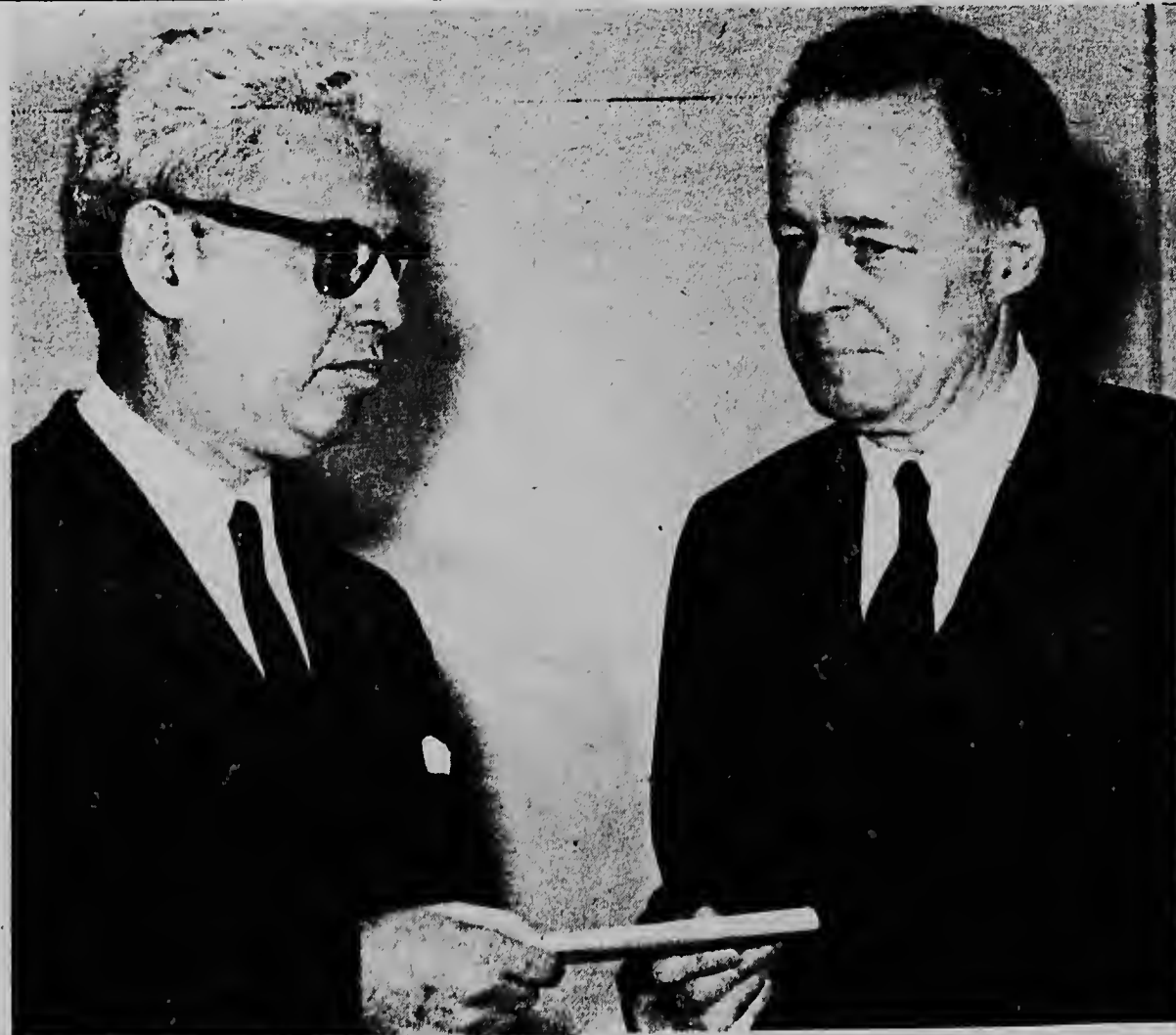
NACIONNAN UNI--Arthur Goldberg, embahador mericano ante Nacionnan Uni, ta presenta un carta di Johnson, pidiendo reunion inmediato di e Consejo di Seguridad di Nacionnan Uni, ne presidente Roger Seydoux, embahador di Francia akinan.

Segun e mes fuentenan, mama di e ex-presidente a declara cu su yiu ta bon, aunque cansá. Circulan oficial a ninga di confirmacion of ninga noticia di e bishita.